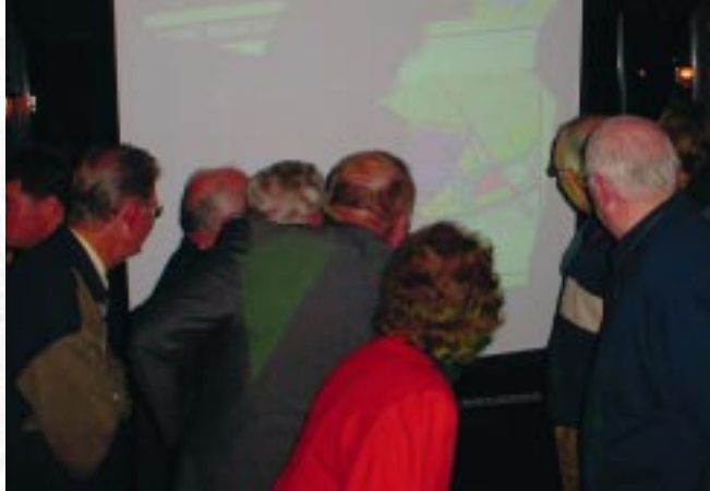
Veel belangstelling tijdens de informatieavond op 24 november jl.

De Veldkamp wordt een zogenaemde C-locatie; geschikt voor bedrijven en voorzieningen met een lage arbeids- en/of bezoekersintensiteit en een hoge autoafhankelijkheid. In het gebied